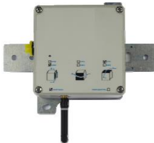
Wireless Smart Datalogger