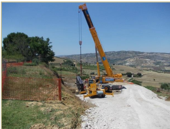
Figura 1 – Il cantiere di Caltagirone (CT).

Su incarico di FIP INDUSTRIAL S.p.A. sono state eseguite n. 18 prove di carico assiale di collaudo su altrettanti pali di fondazione, allo scopo di raccogliere informazioni per la misura dei cedimenti dei pali testati nell'ambito della nuova variante "Strada S.V. Licodia Eubea A/19" nel Comune di Caltagirone (CT). Le opere indagate sono state i viadotti Ippolito e Paradiso e la rotatoria Molona.