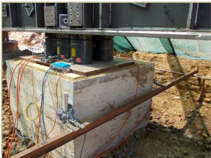
Figura 2 – Misurazione dei cedimenti sulla testa del palo di fondazione.

Il datalogger utilizzato (Data Taker) presentava risoluzione di 15 bit, massima velocità di campionamento pari a 25 campioni/secondo, precisione \pm 0,15\% f.s. e linearità 0,01%.